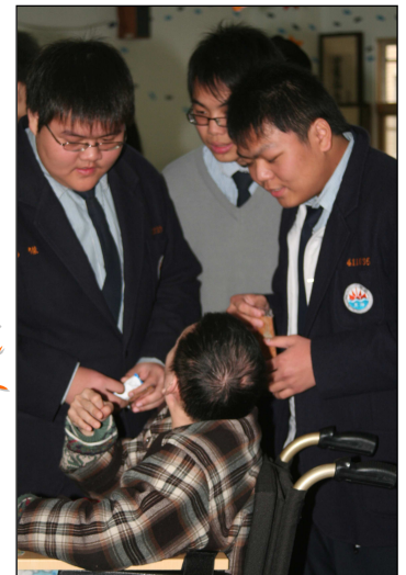
真光教養院 體驗生命